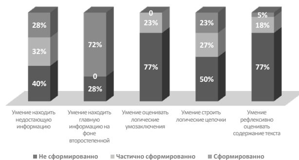
Рис. 3. Результат теста по оценке уровня критического мышления

В категорию «когнитивные функции» входят: умение оценивать логические умозаключения, умение строить логические цепочки, умение рефлексивно оценивать содержание текста. У большинства подростков данные критерии практически не сформированы. У 23% учащихся частично сформировано умение оценивать логические умозаключения. У 50% воспитанников сформировано в той или иной степени умение строить логические цепочки. 23% воспитанников показали сформированность умения рефлексивно оценивать содержание текста (Рис. 3). Это говорит о том, что когнитивные функции, включающие память, речь, умение концентрировать внимание, умение узнавать объекты и др., у наших воспитанников западают в большей степени. Отсюда мы можем сделать вывод об их низкой