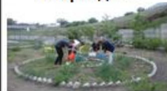
Школьное лесничество «Берендеи»