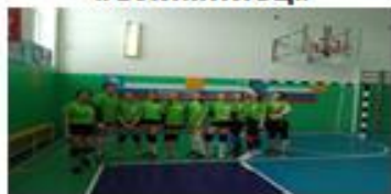
Школьный клуб «Олимпиец»