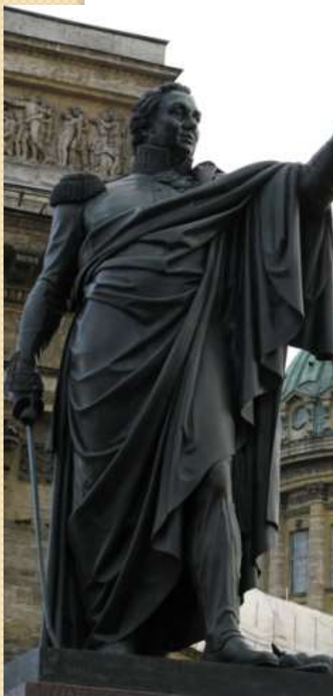
• В Петербурге.