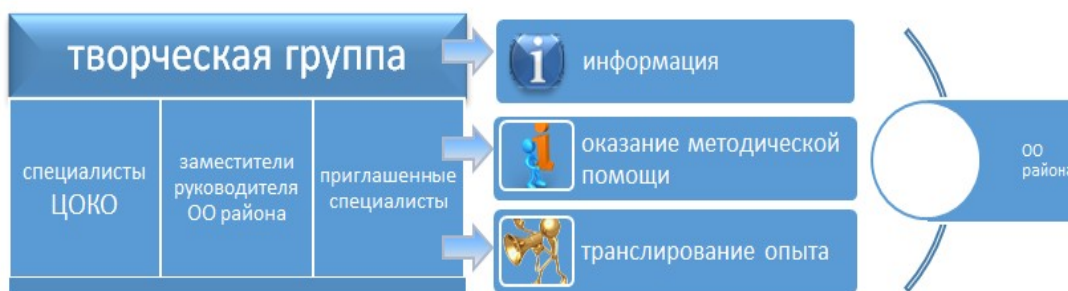
Рисунок 1. «Организация деятельности творческой группы в рамках сервиса «Профиль роста»

Организация деятельности творческой группы в рамках сервиса «Профиль роста» представлена на рисунке 1.