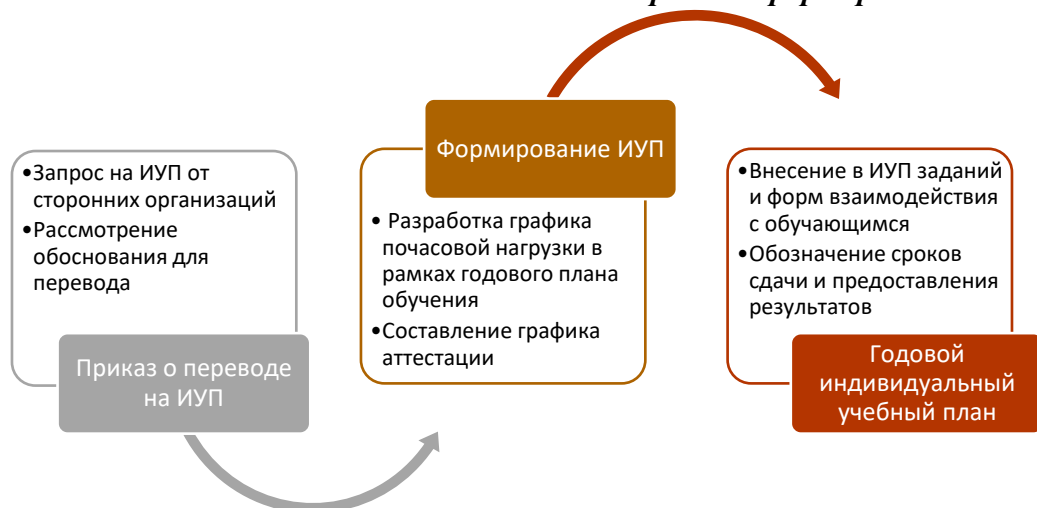
Схема реализации запроса на формирование ИУП