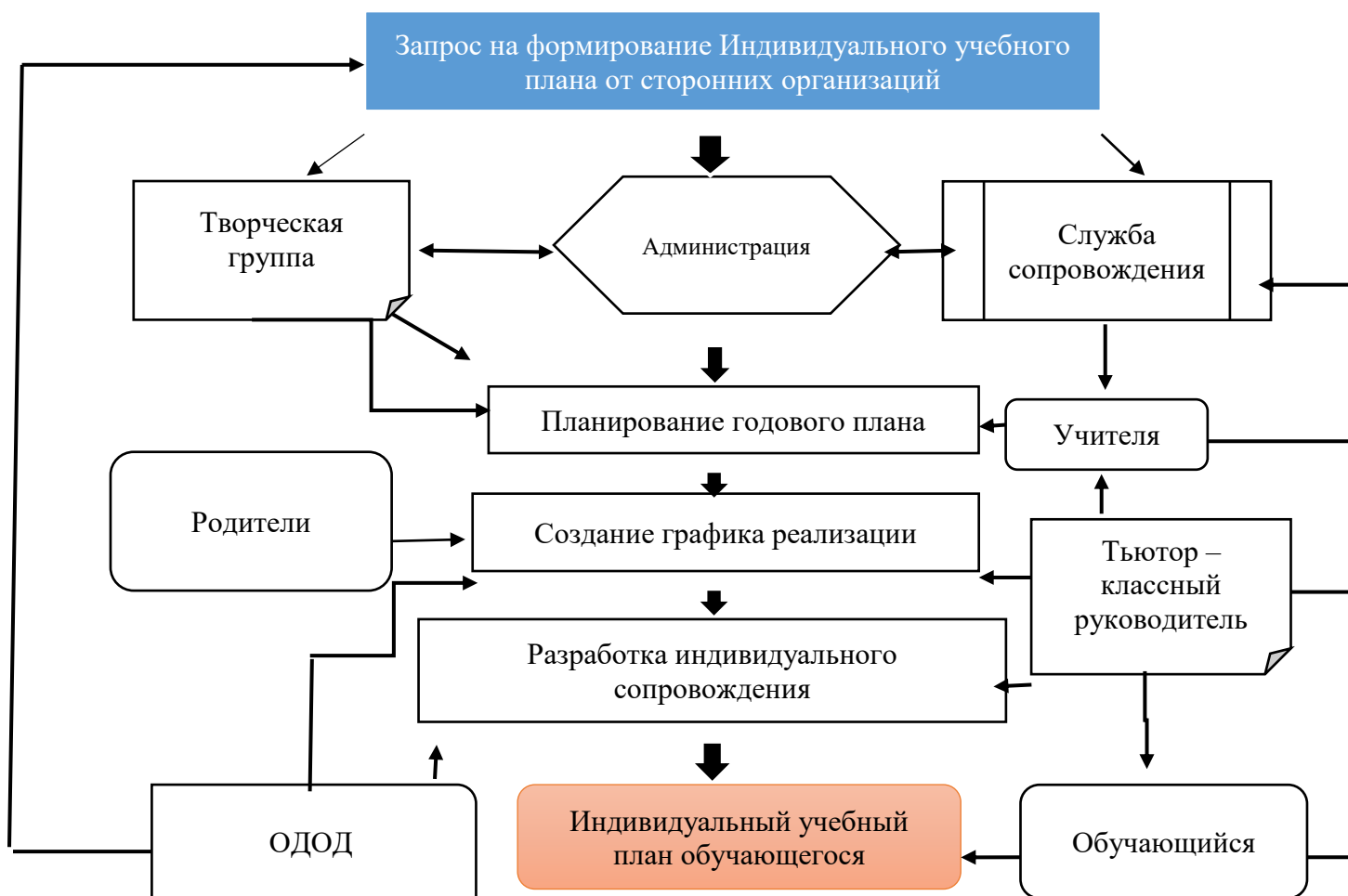
Алгоритм описания взаимодействия участников образовательного процесса при формировании ИУП: