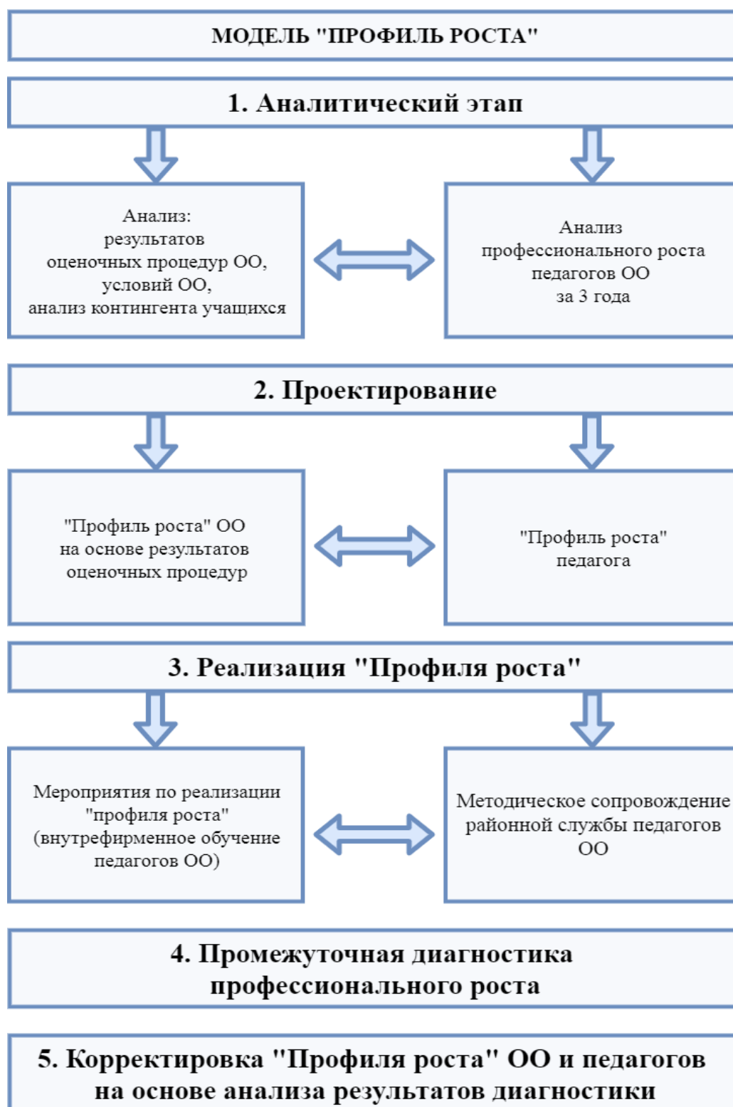
Рисунок 2. Модель "Профиль роста"

Экспертиза результатов реализации профиля роста осуществляется Научно-экспертным советом ИМЦ Калининского района Санкт-Петербурга (далее - НЭС). НЭС является консультативно-совещательным органом, а также организатором экспертных процедур по важнейшим направлениям работы районной