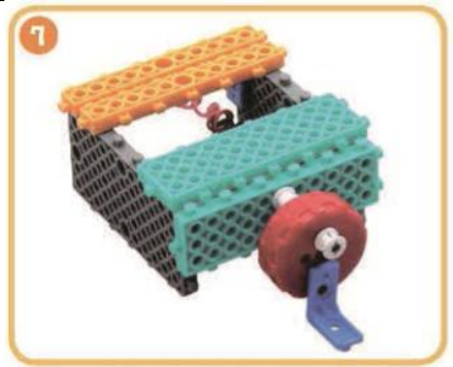
Схема 4 + Схема 6