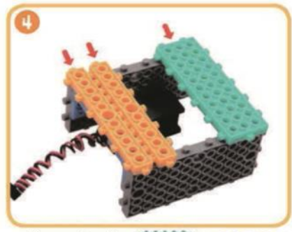
Схема 2 + 3 X1 X2