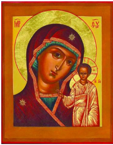
Икона Казанской Божьей матери