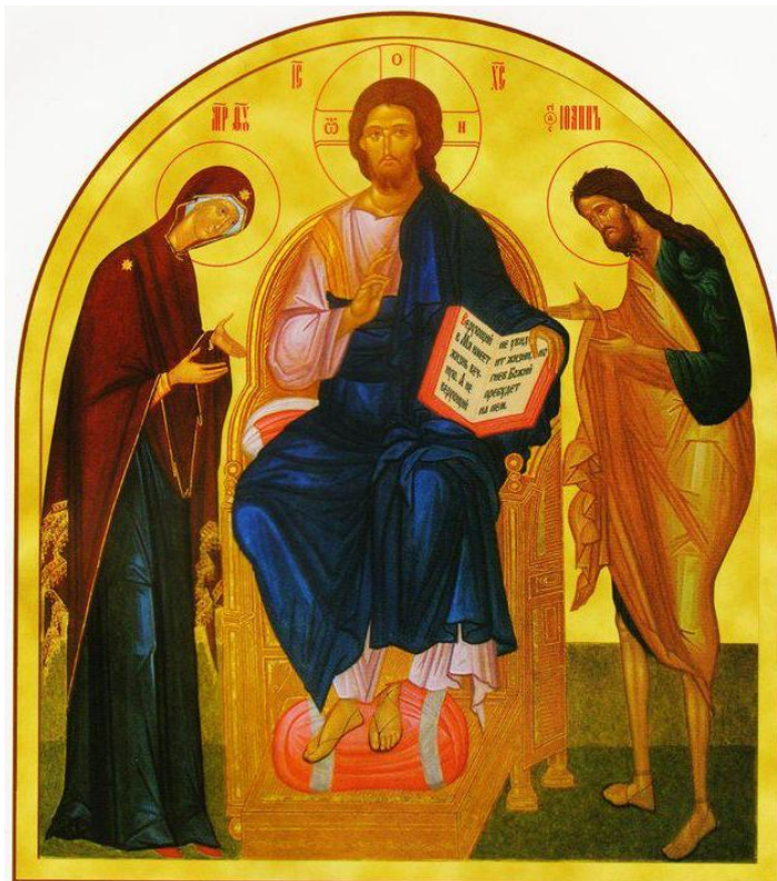
Пресвятая Богородица умолила Своего Сына и Бога помиловать страну нашу в войне 1941–1945 годов. (Из видения старца Валаамского монастыря в 1940 году.)