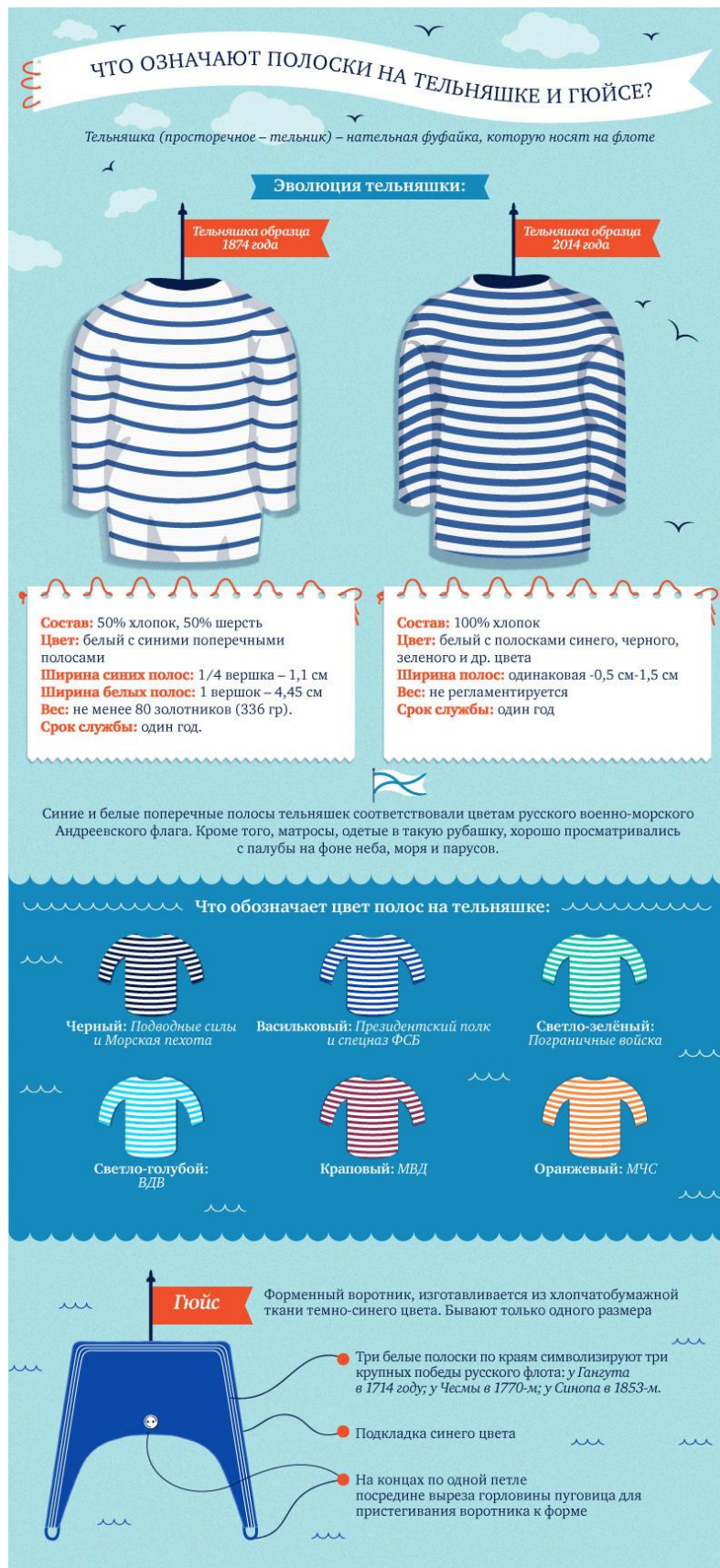
Рис. 4 – Отличительный признаки форменной тельняшки

Священник: (показывает длинную чёрную рясу с рукавами). Вы видели облачение священников, которое отличается яркими цветами украшениями. Но