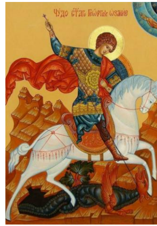
Икона Святого Георгия Победоносца

Учитель: Дети, обратите внимание, что в каждой группе на столе есть макет с лучами. Он красного цвета. В центр макета вписан термин "Воинство", а на лучах написаны определения. Проанализируйте что написано на лучах и отрежьте те из них, которые не подходят под термин "Воинство" (см. рисунок 1)