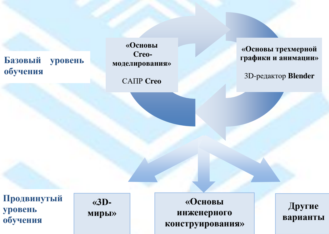
Рисунок 1. Уровни освоения дополнительной общеобразовательной программы «3D-технологии школьникам».

Базовый уровень обучения – последовательное освоение в течение первого года двух модулей: «Основы 3D-моделирования» и «Основы трехмерной графики и анимации» для знакомства школьников с современными инженерными 3D-технологиями, в частности, с системой автоматизированного проектирования Creo и графическим редактором 3D-графики и анимации Blender. Такая возможность позволяет обучающемуся сориентироваться в выборе дальнейшего варианта образовательного маршрута по освоению 3D-технологий. Кроме того, краткосрочные модули обучения позволяют выстроить обучение школьников с использованием сетевых форм взаимодействия с общеобразовательными учреждениями по организации предпрофильной подготовки и профессиональной ориентации школьников, а также по освоению ими информационно-коммуникационных технологий.