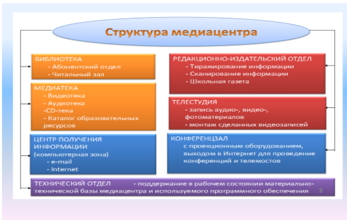
Рис. 2 Структура Медиацентра