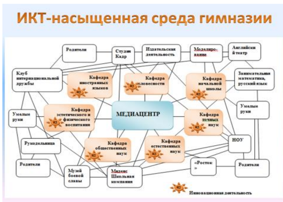
Рис. 3 Информационная образовательная среда гимназии

В МАОУ «Гимназия № 67» реализованы все указанные условия. Гимназия оснащена 168 компьютерами (в том числе 108 ноутбуков), 27 проекторами, 23 интерактивными досками, 24 печатающими устройствами. Все предметные кабинеты оснащены персональными компьютерами. Медиацентр гимназии оснащен 14 современными стационарными компьютерами, соединенными локальной сетью, с высокоскоростным доступом к Интернет и 13 переносными