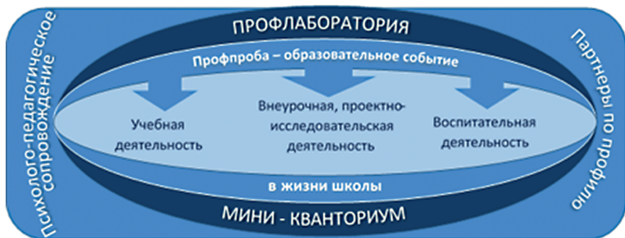
Рис. 1. Модель ранней профилизации

Под кластерным подходом к развитию образования мы понимаем саморазвитие субъектов кластера в процессе работы над проблемой. Кластер – это совокупность согласованно действующих на основе общей цели субъектов, которые объединены определенными договорными отношениями. Реализация кластерного подхода обеспечивает выстраивание