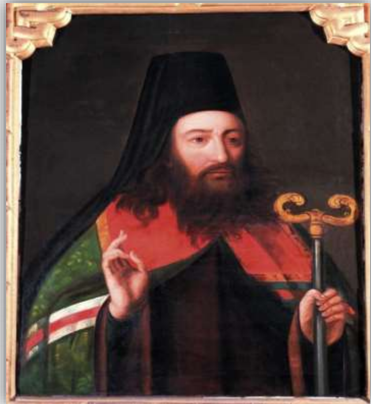
Василий I епископ Рязанский