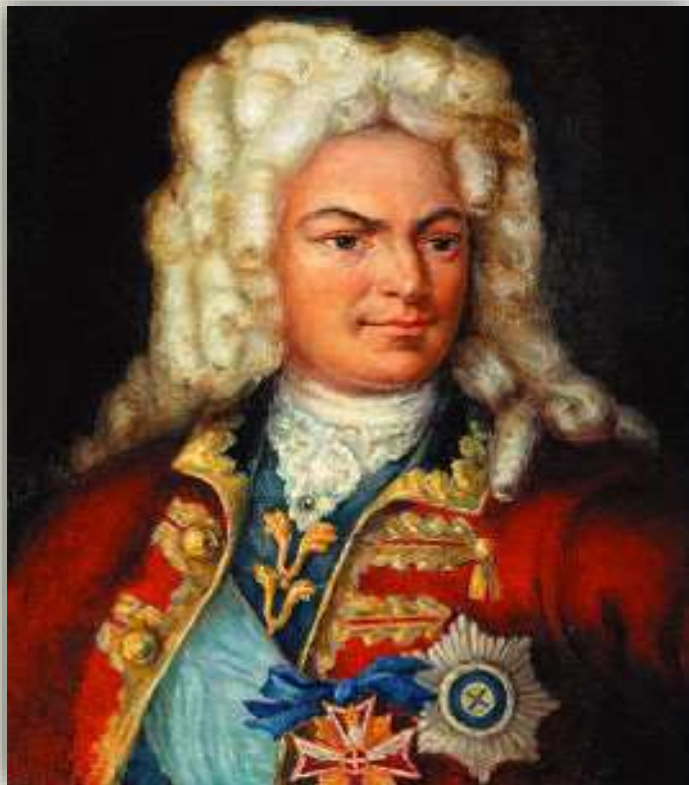
Брюс Яков Вилимович

Авторы издания неизвестны. Предполагаемый составитель — епископ Рязанский. В создании книги принимал активное участие и курировал её издание сподвижник Петра, Яков Брюс.