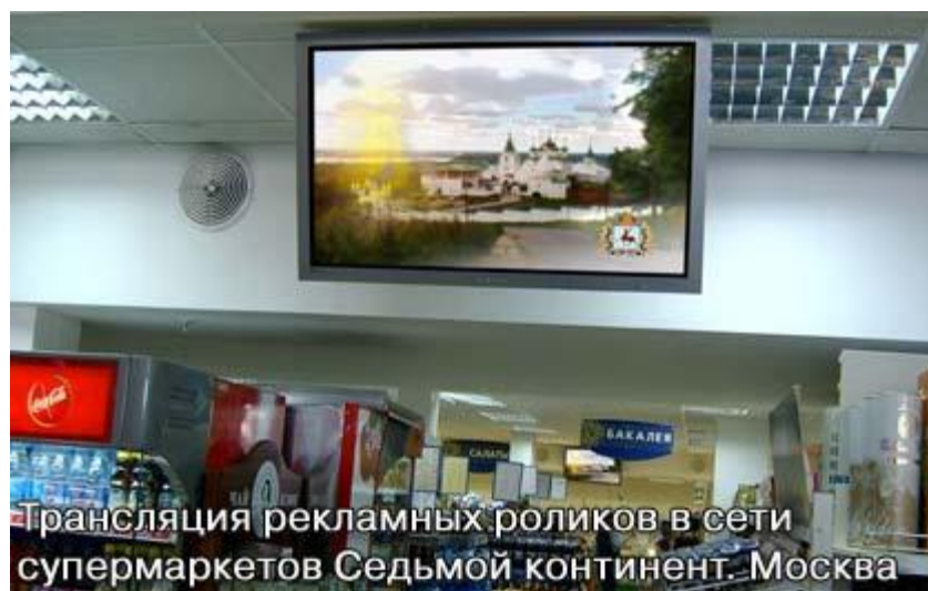
Рис. 2 – Реклама в средствах массовой информации

Какие на ваш взгляд критерии выбора собственного отпуска в турагентстве? В первую очередь, это полная информация о представленном райском месте, его стоимость и, конечно, визуальное представление. Современное общество достигает пика информационного развития и старый уклад канает в бытие. Картинки и фотографии заменяет виртуальность, а ведь это именно то, чего так не хватает в представленной вам информации в тур агентстве. Третья технология – виртуальный просмотр желаемого места отдыха . Он может включать в себя агитирующие видеоролики и панорамное виртуальное перемещение, что играет важную роль. Думаю, Вам бы хотелось заглянуть наперед и узнать, какие места Вы точно сможете посетить и сколько красивых фотографий сможете сделать на память (рис. 3).