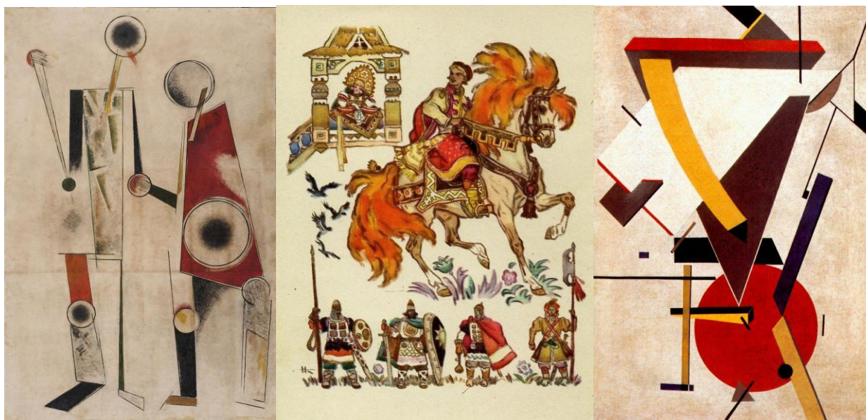
Рис.2 А. Родченко