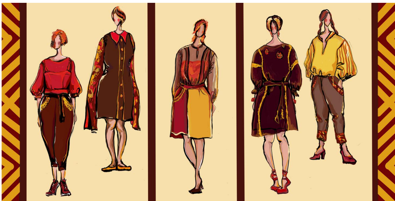
Рисунок 1. Коллекция моделей одежды «Марьюшка»

Коллекция «Марьюшка» (рис.1) повседневного назначения, разработана в городском стиле, предназначена для женщин сегмента «plussize». Творческим источником для коллекции послужили вариации традиционных женских и мужских рубах, бытовавших на территории центральной и южной Руси [6].