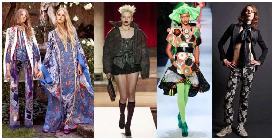
Рис.3. Модели в стили «хиппи» Roberto Cavalli , 2017. Vivienne Westwood , 2019 панк стиль. Модель в стиле «фанк» Jean Paul Gaultier , 2019. Модель в стиле «глэм», Viktoria Backham , 2013.

популярностью движения под лозунгом «Любовь и мир» стали актуальны андрогинные образы и возврат к этническим традициям. Панки, возникшие в противовес хиппи, использовали фетишизм и эпатаж общественности. Их образ отличался грубостью и жесткостью. Однако, обе субкультуры имели ряд объединяющих характеристик: неопрятность, провокационность и черты унисекса. В этот же период появились два тождественных направления в молодежной культуре – фанк и глэм. И если фанк возвращает нас к имиджу зутис 40-х годов, то глэм доводит до предела концепцию смешения полов как в одежде, так и в социальных ролях. Эти стили вновь стали актуальны в 90-е годы, когда В. Вествуд вывела моду панков и глэм-музыкантов на подиум Высокой моды [5].