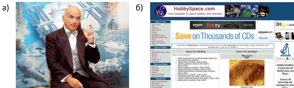
Рис. 1 – Космический туризм: