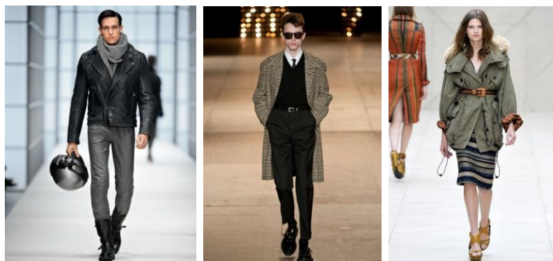
Рис.2. Модель в байкерском стиле Hugo Bos , 2018г. Модель в стиле «теддис» Saint Laurent , 2015 г. Модель парки из коллекции Antonio Marras , 2016 г.

Яркими представителями середины XX столетия были английские «теддис», в Америки – «рокобилли», в Советском Союзе – «стиляги». Их внешний вид определялся яркими длинными пиджаками, узкими и укороченными брюками-дудочками, бабочкой или шнурком вместо галстука. И вот в коллекции Saint Laurent осень – зима 2015г., мы видим эти образы, сошедшие на улицы городов, как модные тенденции для масс-маркета. Из субкультуры английских «теддис» выделились «моды», со своей одержимостью и культом моды [4]. Они предложили парки, которые с успехом заимствовали дизайнеры Burberry Prorsum , Antonio Marras Fall , Jean Paul Gaultier и др.