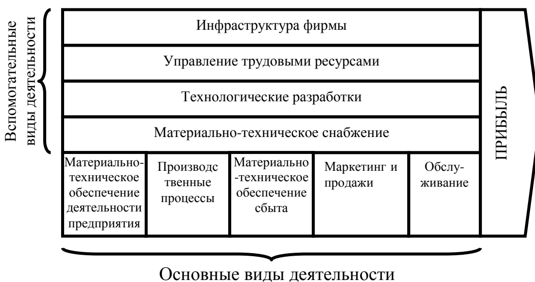
Стандартная цепочка создания ценностей по Портеру М. [3, с. 214]

Теорию конкурентных преимуществ разработал Портер М. Она пришла на смену теории сравнительных преимуществ Давида Рикардо, который считал, что те обусловлены использованием страной или отдельной фирмой находящихся в изобилии факторов производства – трудовых и сырьевых ресурсов, капитала и пр.