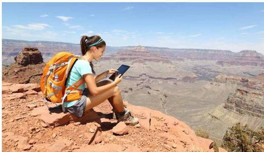
Рис. 4 – Информационная доступность

Согласитесь, иной раз отстранение от туризма вызывает отсутствие сети. Думаю, иногда это даже приносит вред человеческой жизнедеятельности. Кому же понравится туризм в такой ситуации. Во время путешествий внутри страны или за ее пределами серьезной проблемой станет незнание маршрута, что порождает за собой цепочку проблем: отсутствие интернет ресурса из-за отсутствия сотовой связи. Но и тому есть решение! Обозначу свою, четвертую и конечную технологию – доступная 5G сеть для далеких и отстранённых мест нахождения . Данная технология облегчит передвижение по незнакомым местам, что поможет в развитии туризма (рис. 4).