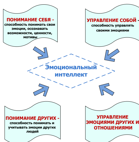
Рисунок 1. Основные направления развития эмоционального интеллекта школьников

Исходя из этого, можно сформулировать основные направления развития эмоционального интеллекта, объединив их в 4 группы: 1) понимание собственных эмоций; 2) управление собой (в том числе управление стрессом); 3) понимание других людей (включая эмпатию); 4) управление эмоциями других и взаимоотношениями (рис.1).